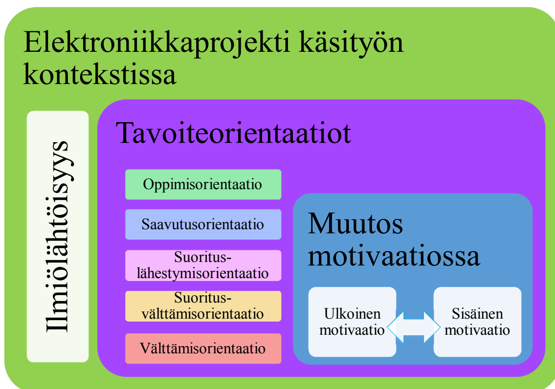
KUVIO 1. Tutkielman teoreettinen viitekehysmalli

Viitekehysmalli on asetelma tutkittavasta ilmiöstä, josta tulee ilmi tutkimukseen liittyvät käsitteet sekä niiden väliset yhteydet. Viitekehysmalli pyritään visualisoimaan mahdollisimman havainnollistavaksi käyttämällä esimerkiksi värejä. Havainnollistamisessa tulee kuitenkin myös huomioida yksinkertaisuus ja selkeys, koska viitekehysten tarkoituksena on selvittää tutkimuksen lähtökohdat ytimekkäästi. (Anttila 2005, 167.)