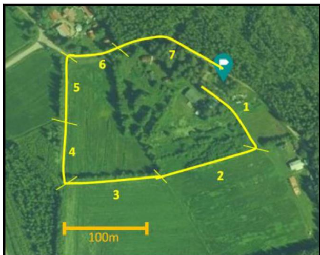
Esimerkki laskentalinjasta (7 laskentalohkoa).

Tämän jälkeen voit aloittaa laskennan. Kunkin laskentalohkon havainnot kirjataan erikseen. Kävele linjaa tasaista vauhtia ja kirjaa edessäsi olevassa 5×5×5 m ”ruudussa” havaitsemasi kimalaisyksilöt, vaikkapa tukkimiehen kirjanpidolla. Kauempana havaittuja yksilöitä ei kirjata. Haavi on tarpeellinen apuväline! Havaintojen lajinmäärityksen tarkkuuteen on ohjeistusta kääntöpuolella!