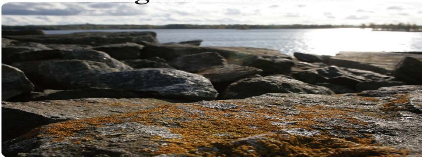
Pohjois-Karjalan maaseutustrategia 2014 - 2020