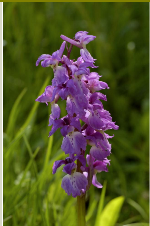
Miehenkämmekekä on rauhoitettu orkidea ja Tanskan Odderin kunnan vastuulaji.

Postikorttikampanjan tavoitteena oli saada kunnanjohtajien ja kuntien huomio siihen, että heille on siirtynyt vastuu luonnon suojelusta. Tarkoituksena oli myös lisätä tietoa uhanalaisista kasvi- ja eläinlajeista. Ideana oli, että kun valitaan yksi vastuulaji kullekin kunnalle, tulee lajien uhanalaisuus kuntien päättäjille konkreettiseksi ja silminnähtäväksi. Annettaessa vastuu paikalliselle viran-omaiselle muistutetaan kuntien uudesta vastuualueesta, mutta myös lisätään paikallista kiinnostusta asiaan. Yhden valitun vastuulajin nimeäminen lisää toivottavasti myös kiinnostusta muita kunnan alueella esiintyviä harvinaisia lajeja ja niiden elinympäristöjä kohtaan.