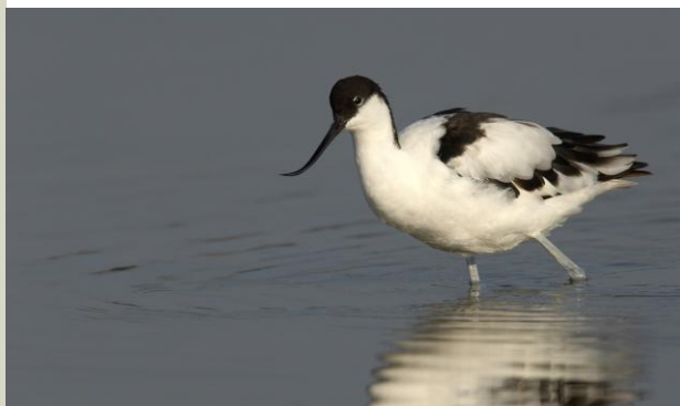
Avosetti rauhoitettiin Tanskassa vuonna 1922.

Tanskassa viherkonna ( Bufo viridis ) on harvinainen ja esiintyy vain yksittäisissä paikoissa saarilla, kuten Greven kunnassa. Viherkonna on lämpöä vaativa laji ja sen lisääntymislammikoiden on oltava paahteisia ja matalia, jotta niiden kudusta voi kehittyä nuijapäitä ja lopulta viherkonna. Siksi järviruo'on aiheuttama nopea kutulammikoiden umpeenkasvu aiheuttaa suuria ongelmia viherkonnalle. Auttaakseen vastuulajinsa selviytymistä on Greven kunta ryhtynyt yhteistyöhön Strandparken I/S:n ja Tanskan luonnonsuojelu-yhdistyksen kanssa. Seitsemän lammikkoa on raivattu ja neljä uutta on kaivettu vuoden 2007 jälkeen. Tulokset ovat olleet ilmeisiä. Heti seuraavana vuonna oli uudet lammikot asutettu. Vuonna 2009 kuultiin urosten kurnutusta ja havaittiin kutua kahdeksassa yhdestätoista kutulammikosta.