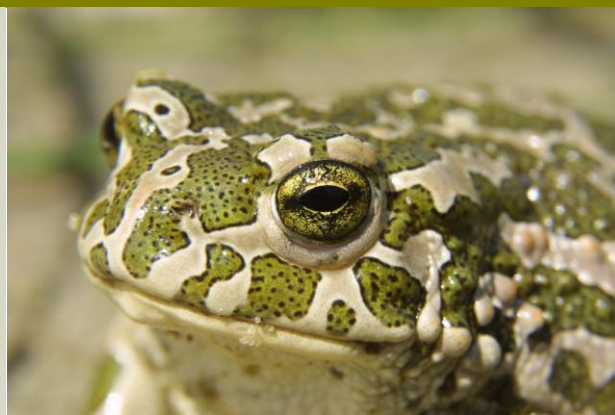
Viherkonna.