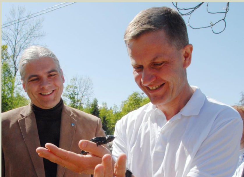
Norjan ympäristöministeri Erik Solheim rupilisko kädessään.

Norja innostui Tanskan menestyksellisestä postikorttikampanjasta ja seurasi esimerkiksi vuonna 2008. Norjan ympäristöministeri Erik Solheim lähetti postikortin jokaiseen Norjan kuntaan. Kukin 430 kunnan kunnanjohtaja sai yksilöllisen postikortin, jossa kunnanjohtajaa pyydettiin huolehtimaan kyseisestä kuntansa alueella elävästä uhanalaisesta lajista. Ympäristöministeri Erik Solheim käynnisti postikorttikampanjan poseeraamalla televisiolähetyksessä Nesodden kunnassa kunnan vastuulaji rupilisko ( Triturus cristatus ) kädessään. Kampanjan ottivat hyvin vastaan sekä kunnanjohtajat että lehdistö. Media oli erityisen kiinnostunut ja esimerkiksi eräs radiokanava esitteli ohjelmassaan yhden vastuulajeista joka sunnuntai koko vuoden 2008 ajan.